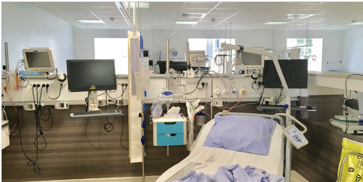
■ GAINÉ TECHNIQUE FLUIDYS HORIZONTALE, SALLE DE RÉVEIL