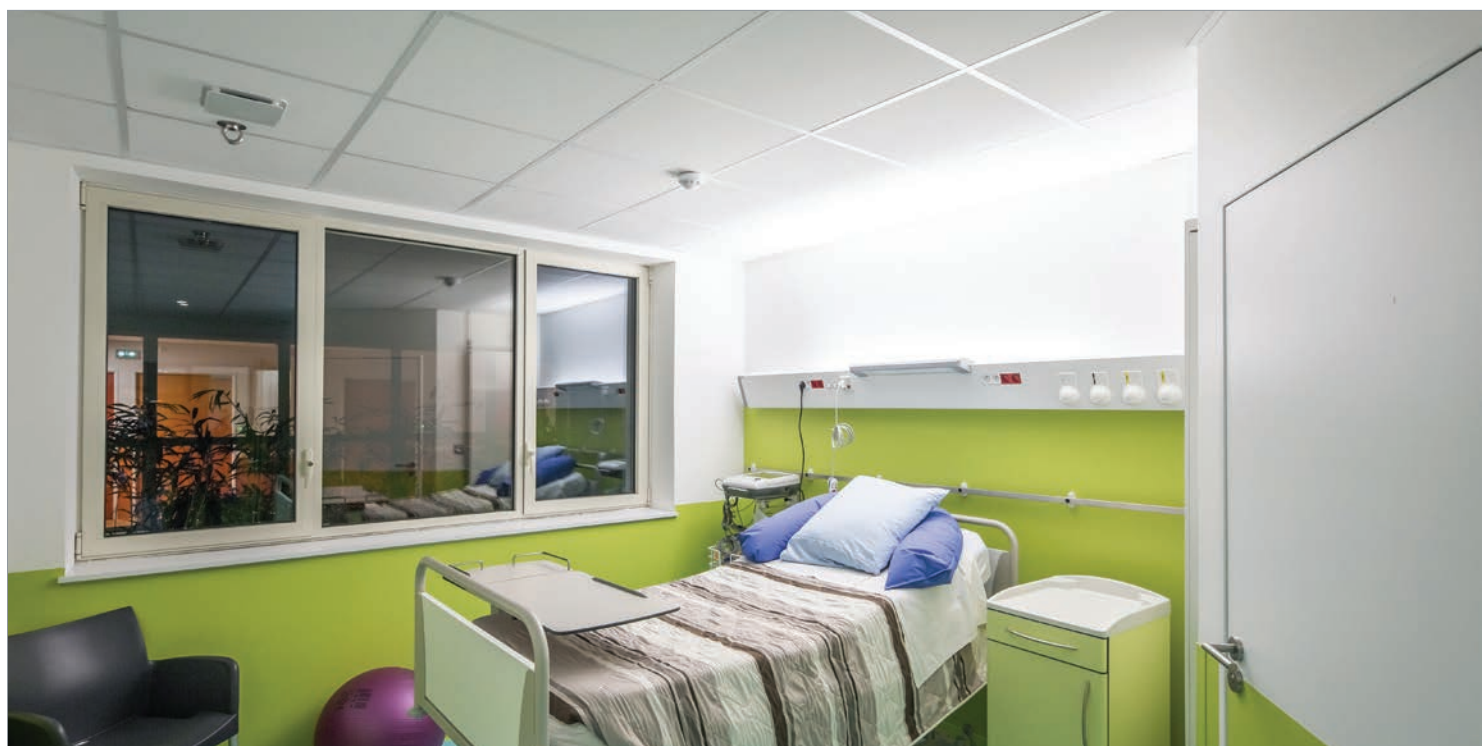
■ GAINÉ TÊTE DE LIT MEDISSIMA, CHAMBRE D'HÉBERGEMENT, MATERNITÉ