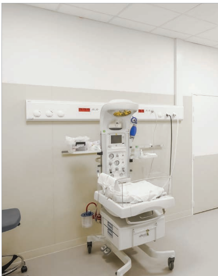
■ GAINÉ TECHNIQUE FLUIDYS, SERVICE NÉONATOLOGIE, MATERNITÉ