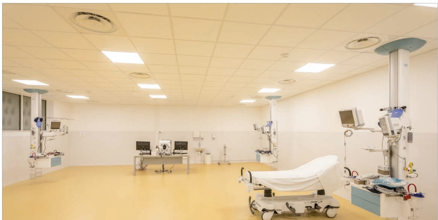
■ COLONNE DE DISTRIBUTION SUSPENDUE MULTICARE EVOLUTION, SALLE DE RÉVEIL