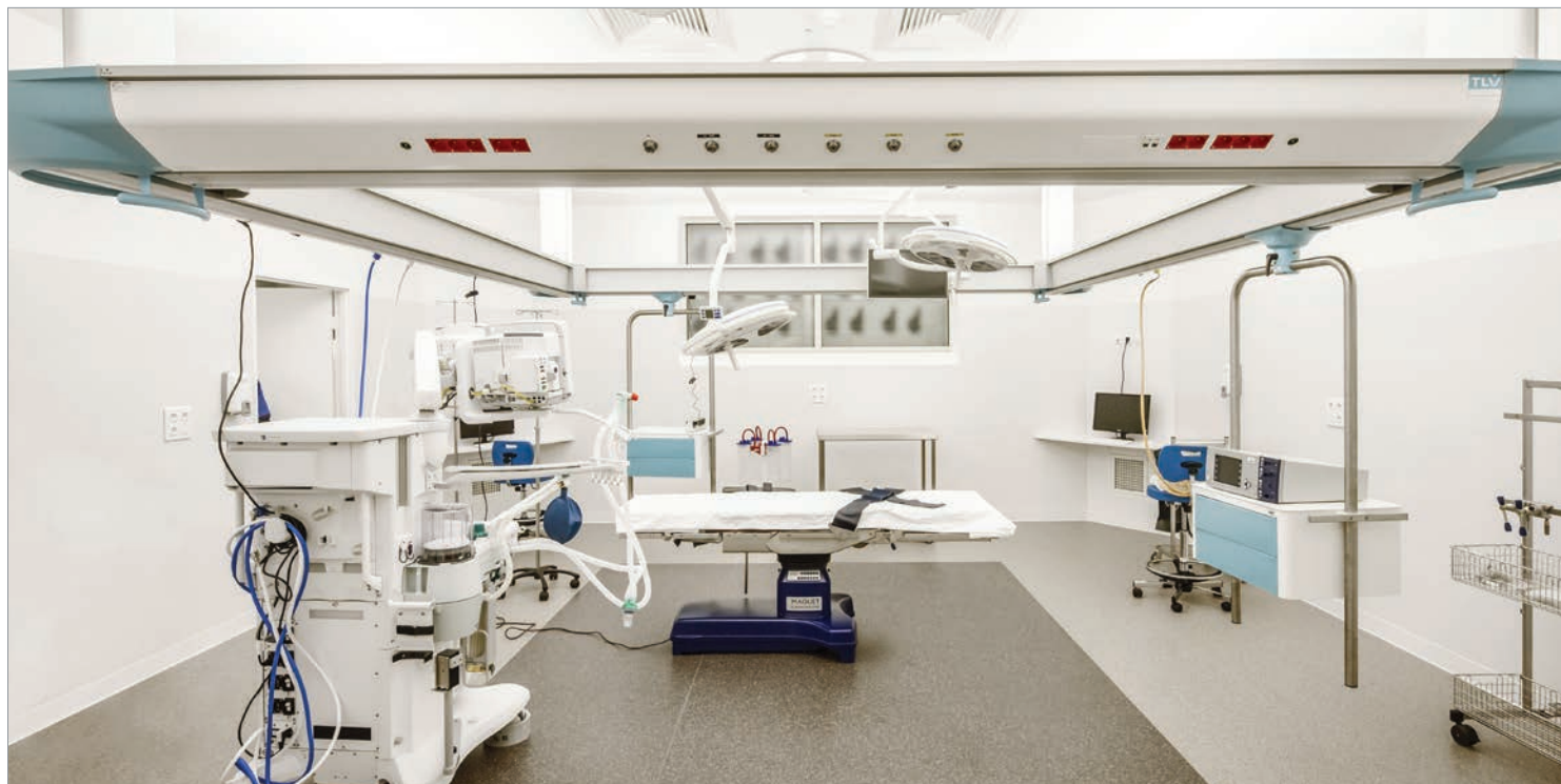
■ POUTRE DE DISTRIBUTION SUSPENDUE HI-CARE, BLOC OPÉRATOIRE