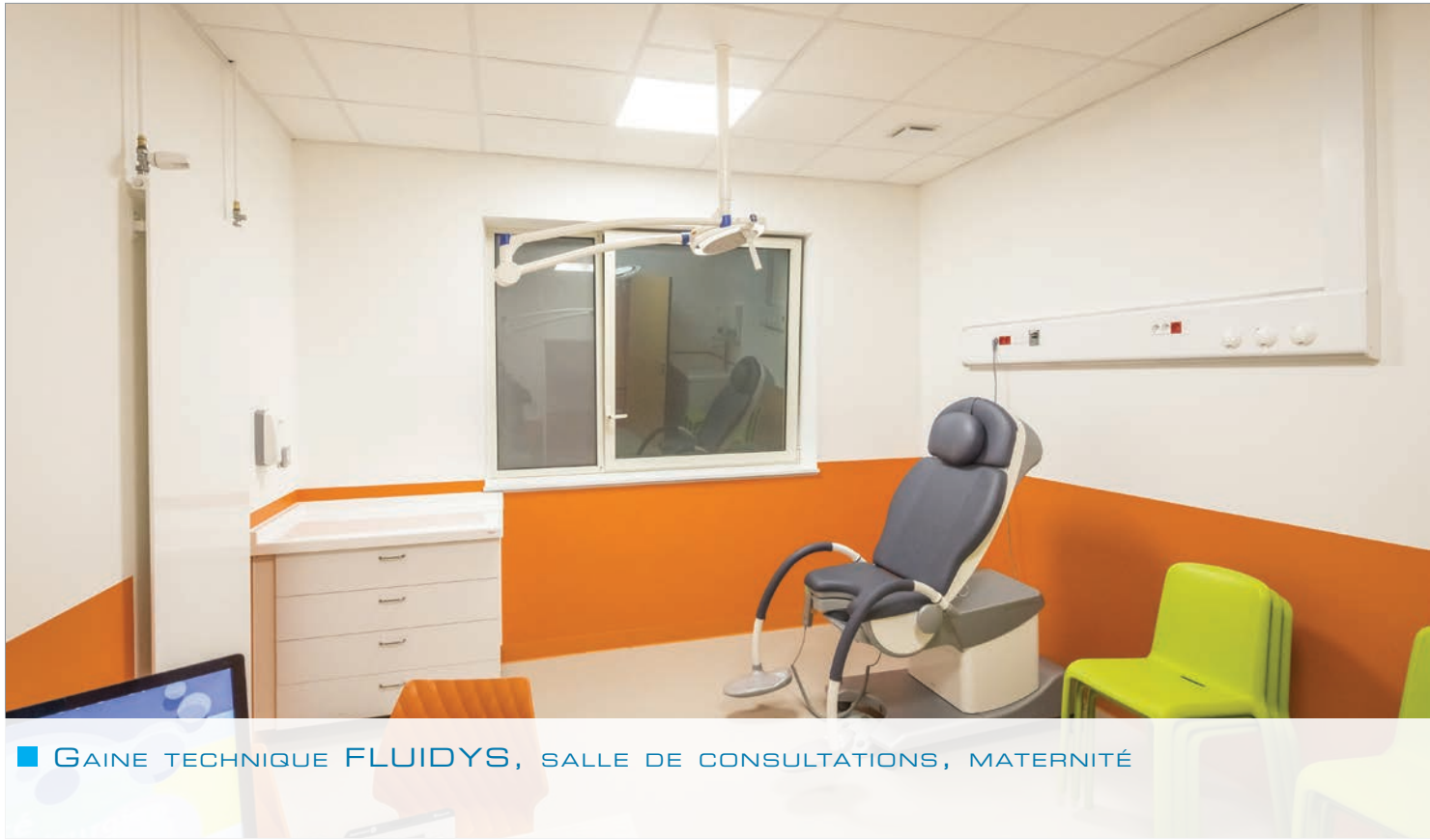
■ GAINÉ TECHNIQUE FLUIDYS, SALLE DE CONSULTATIONS, MATERNITÉ