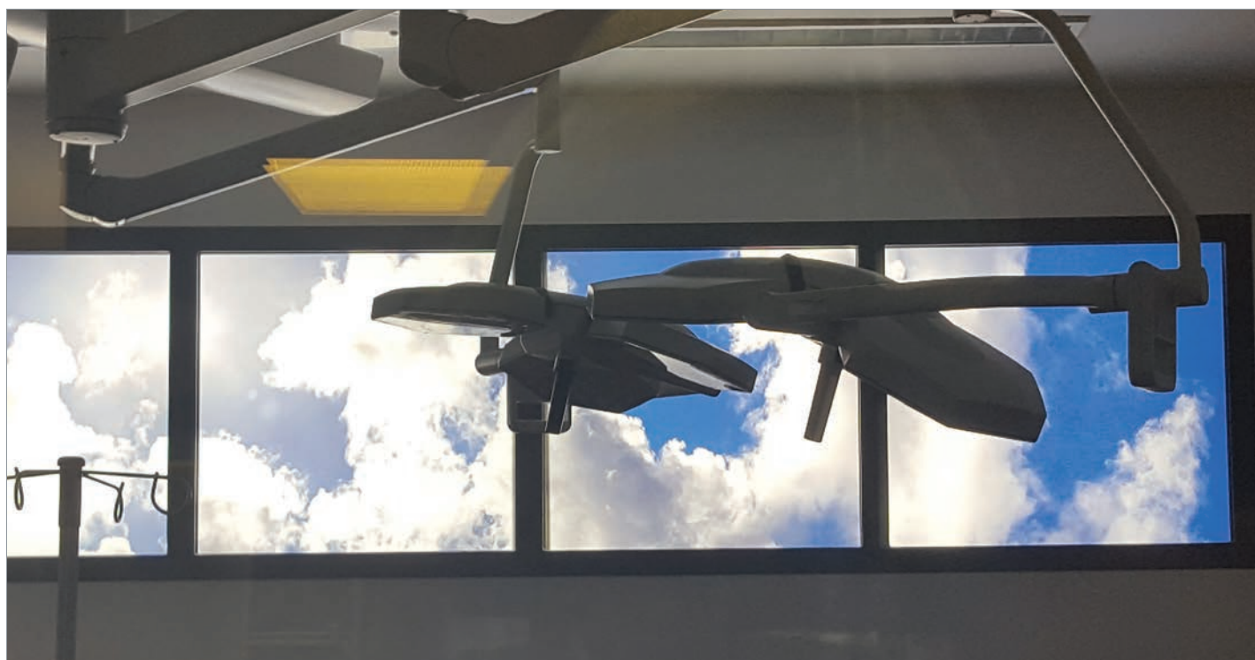
■ LUMINAIRES SKYDECO SUR-MESURE, BLOC OPÉRATOIRE