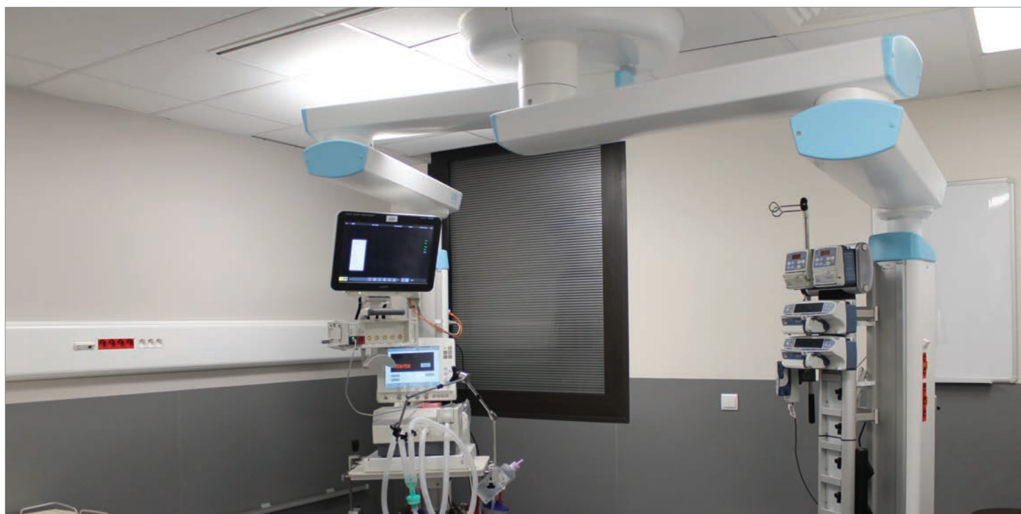
■ BRAS DE DISTRIBUTION TECH-CARE, UNITÉ DE SURVEILLANCE CONTINUE - RÉANIMATION