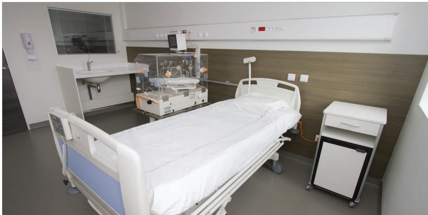
■ GAINÉ TÊTE DE LIT FLUIDYS, CHAMBRE D'HÉBERGEMENT NÉONATOLOGIE, MATERNITÉ