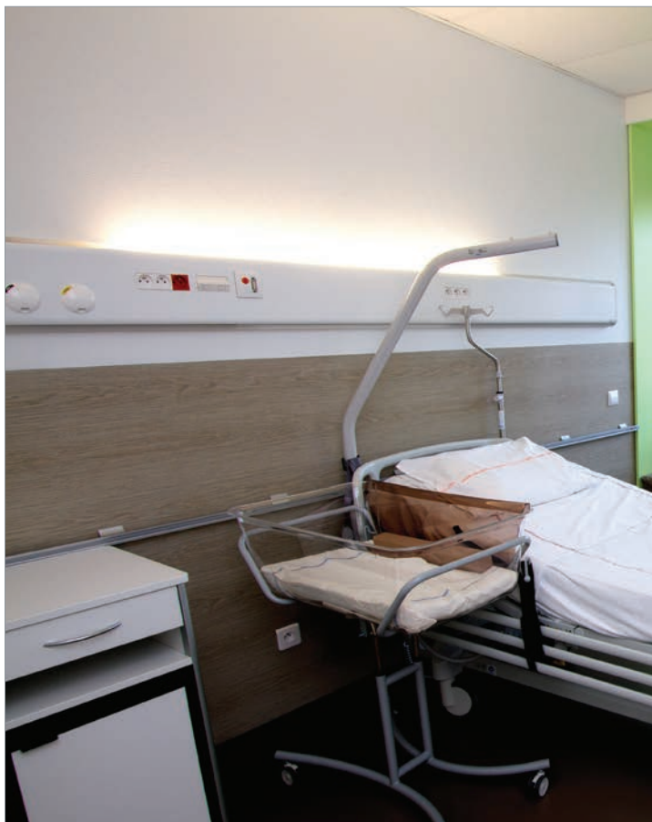
■ GAINÉ TÊTE DE LIT FLUIDYS, CHAMBRE D'HÉBERGEMENT, MATERNITÉ