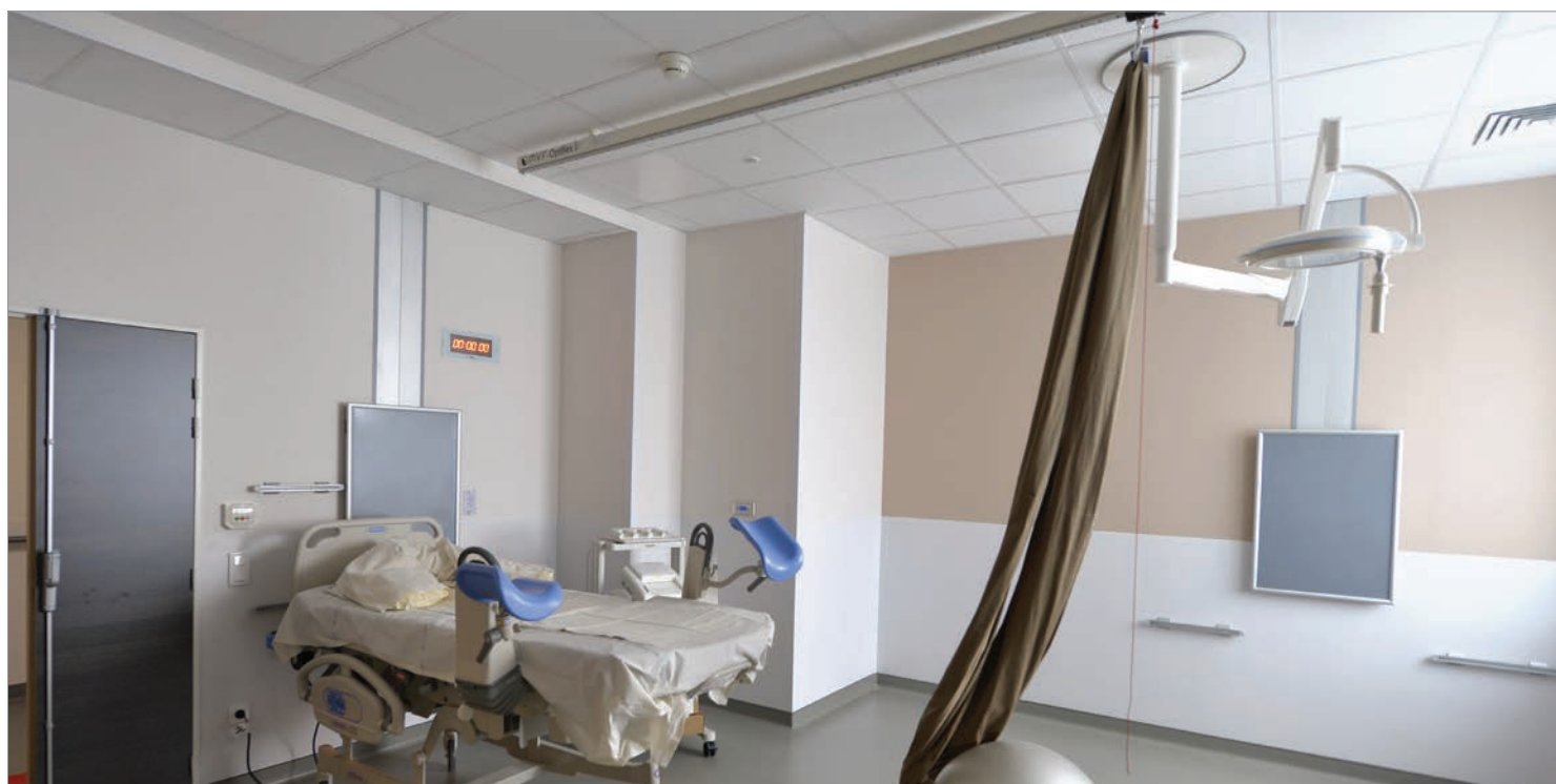
■ PANNEAUX DE DOUBLAGE, SALLE DE NAISSANCE, MATERNITÉ