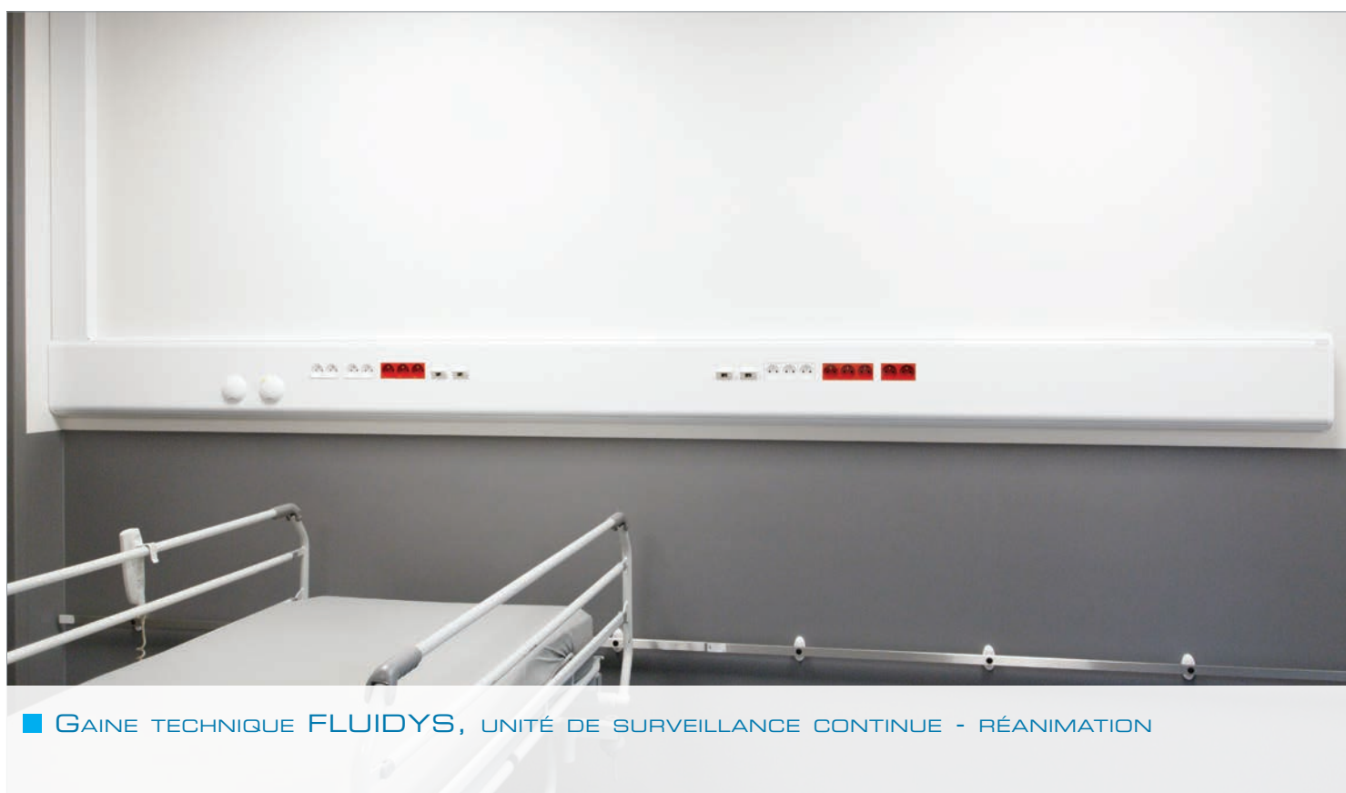
■ GAINE TECHNIQUE FLUIDYS, UNITÉ DE SURVEILLANCE CONTINUE - RÉANIMATION